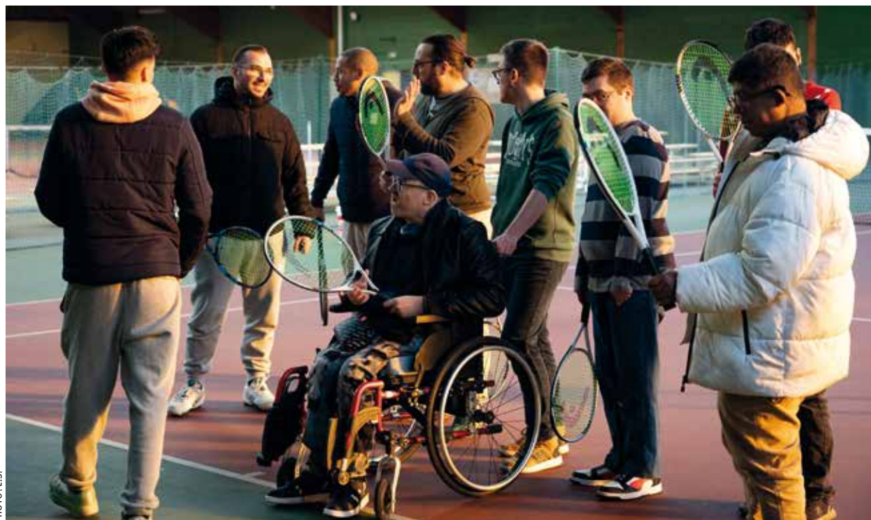
◀ Au club de tennis, les personnes en situation de handicap sont les bienvenues.